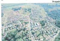
RUAS ganharam pavimentação

Empreiteira Moro vence licitação por R$ 3,4 milhões