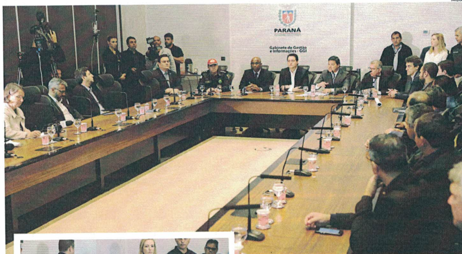
RATINHO JUNIOR diz que a escolha do pacote de obras foi técnica