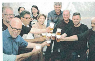
Celebração foi com chope