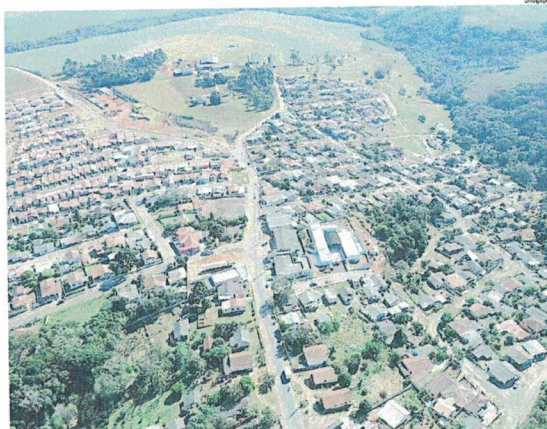
Doze ruas ganharão pavimento asfáltico

Carambeí - A Empreiteira Moro venceu a licitação na modalidade concorrência pública nº02/2019, realizada nesta segunda-feira (21), nas dependências da Prefeitura de Carambeí, para realizar obras de pavimentação asfáltica nas ruas das vilas Banana e Mangabeira, no bairro AFCB. Os investimentos para pavimentar doze ruas ultrapassam os R$ 3,4 milhões, que serão aplicados em obras de drenagem, construção de galerias pluviais,