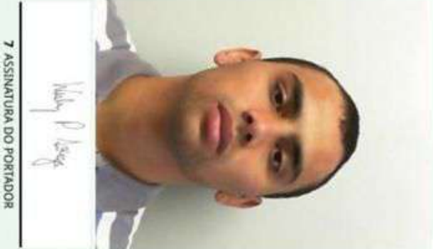
7 ASSINATURA DO PORTADOR